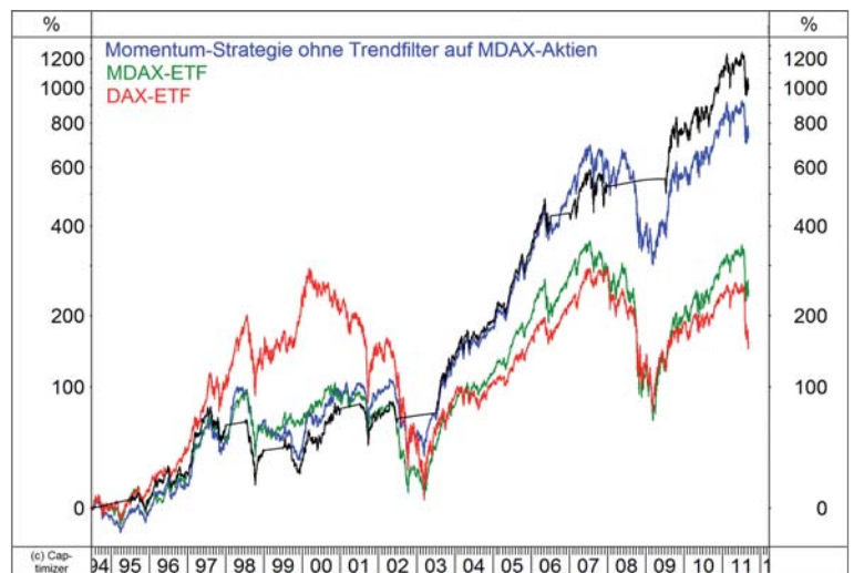
Bild 1 zeigt die Wertentwicklung der Momentum-Strategie auf die MDAX-Aktien mit (schwarze Linie) und ohne Trendfilter (blaue Linie) im Vergleich zur Entwicklung eines MDAX-ETFs (grün) und eines DAX-ETFs (rot).